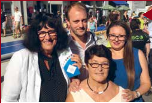
BLOIS Club de gym La Blésoise.