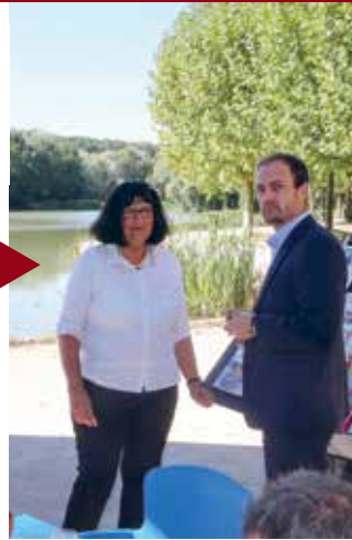
BLOIS Restaurant associatif du lac de la Pinçonnière.