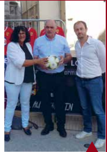
BLOIS Fête du sport.