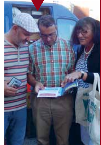
BLOIS Collège Bégon (Segpa).