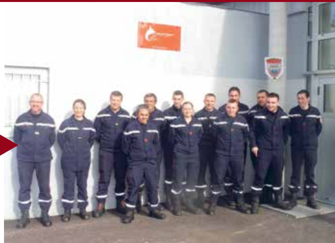
OUCHAMPS Centre de secours cantonal.