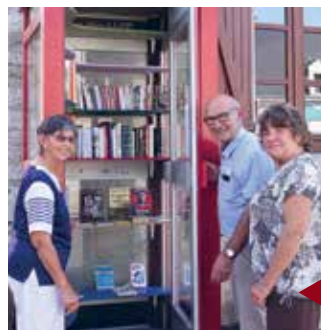
SAMBIN Nouvelle boîte à livres.