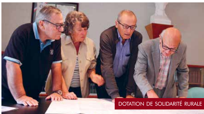
DOTATION DE SOLIDARITÉ RURALE

Créée en 2009, l'association « Le Jardin de Cocagne » emploie aujourd'hui 35 salariés. Située à Blois-Vienne, sur un terrain de 7 ha, l'association permet à des personnes en insertion professionnelle d'être parrainées par des professionnels du maraîchage. Les consommateurs s'y retrouvent, car ils peuvent acheter à prix doux des légumes bio toute l'année.