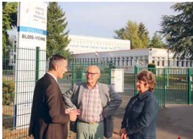
BLOIS Collège de Blois-Vienne.