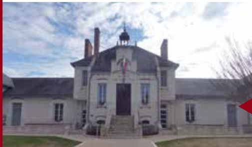
LES MONTILS Place du Souvenir.