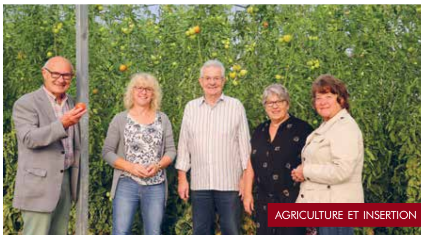
AGRICULTURE ET INSERTION

Deux nouveaux groupes scolaires, à Monthou-sur-Bièvre et Candé-sur-Beuvron, ont été construits ces trois dernières années avec l'aide du Département. À Sambin et aux Montils, deux groupes scolaires ont été agrandis.