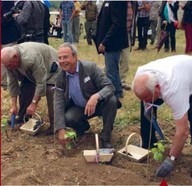
CHAMBORD Plantation de la vigne en 2016.