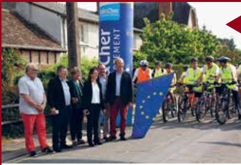
BRACIEUX Départ des élèves pour l'Euro Vélo Cité.