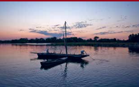
Le port de Saint-Dyé-sur-Loire.

Bracieux • Bauzy • Chambord Courmemin • Crouy-sur-Cosson Dhuizon • Fontaines-en-Sologne Huisseau-sur-Cosson La Ferté-Beauharnais La Ferté-Saint-Cyr La Marolle-en-Sologne • Maslives Montlivault • Mont-près-Chambord Montrieux-en-Sologne Neung-sur-Beuvron • Neuvy Saint-Claude-de-Diray Saint-Dyé-sur-Loire Saint-Laurent-Nouan • Thoury Tour-en-Sologne • Villeny