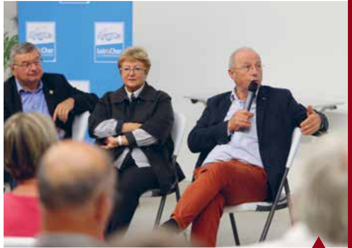
BRACIEUX Rencontre avec les habitants du canton.