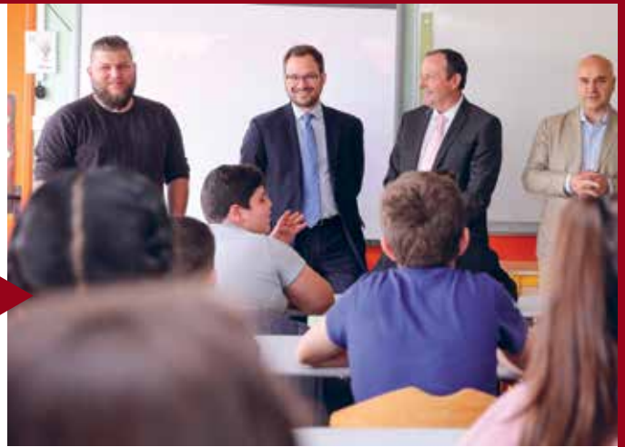
ROMORANTIN-LANTHENAY Présentation des films Nota Bene au collège Léonard-de-Vinci.