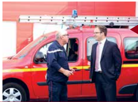
ROMORANTIN-LANTHENAY Visite du nouveau Centre de secours.