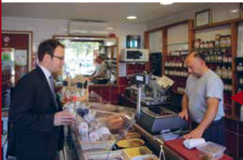
ROMORANTIN-LANTHENAY Capitale de la gastronomie en Sologne.