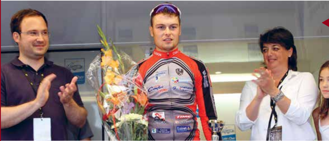
VERNOU-EN-SOLOGNE Étape du Tour du Loir-et-Cher (TLC).