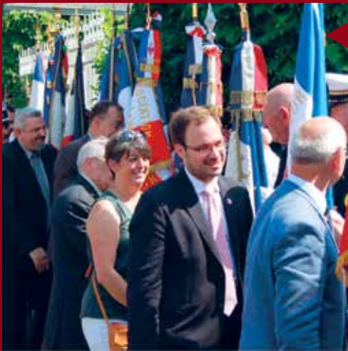
ROMORANTIN-LANTHENAY Cérémonie patriotique du 14 Juillet.