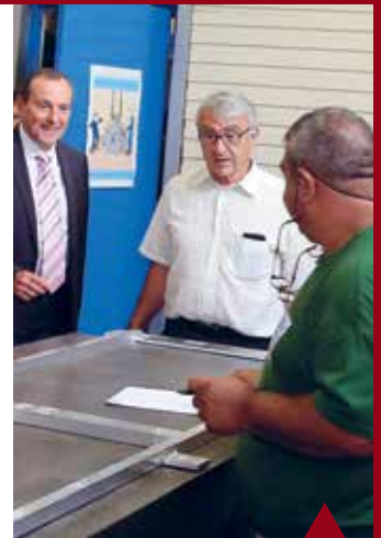
SAINT-AIGNAN Entreprise Barat.