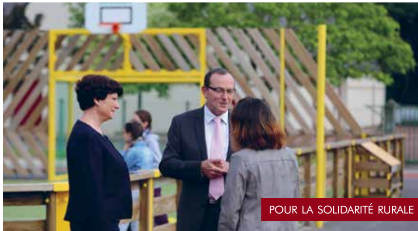
POUR LA SOLIDARITÉ RURALE