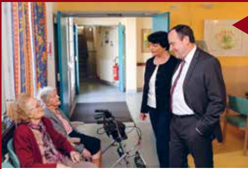
CHÂTEAUVIEUX Visite de l'Ehpad Le Château.