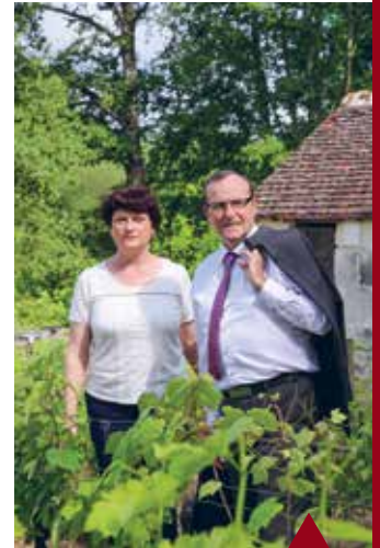
CHÂTEAUVIEUX Musée de la vigne et du vin.