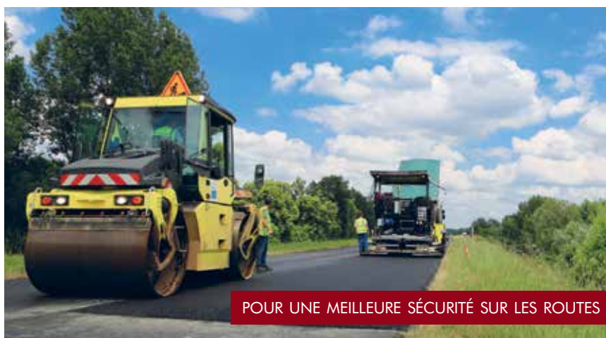
POUR UNE MEILLEURE SÉCURITÉ SUR LES ROUTES

Déploiement du wifi dans le collège Joseph-Paul-Boncour à Saint-Aignan. D'ici à 2020, tous les collèges du département seront équipés de tablettes interactives pour un meilleur apprentissage.