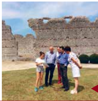
THÉSÉE Site antique de Tasciaca.