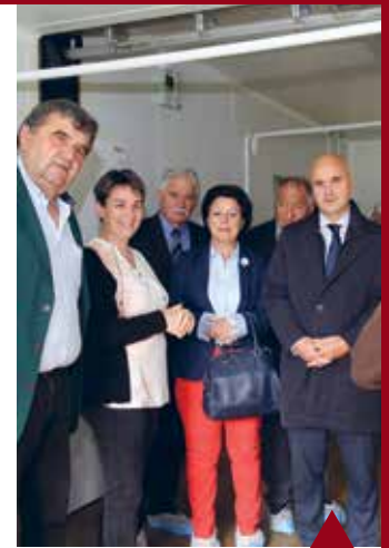
LANGON Ferme des Guillemeaux.