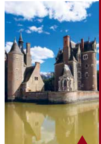
LASSAY-SUR-CROISNE Château du moulin.