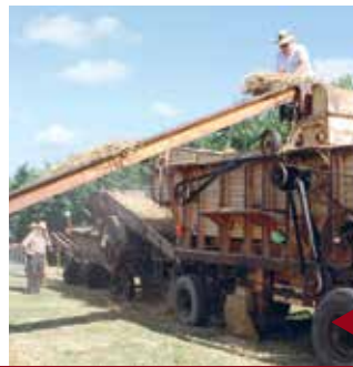
MARAY Foire des battages.