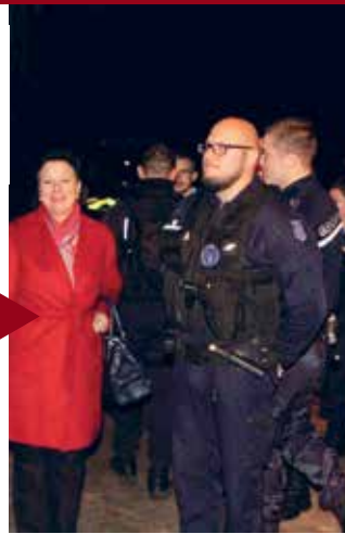
DANS LE CANTON Contrôle nocturne de gendarmerie.