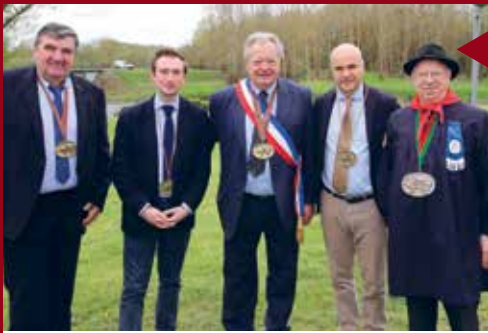
PRUNIERS-EN-SOLOGNE Confrérie des goûteurs.